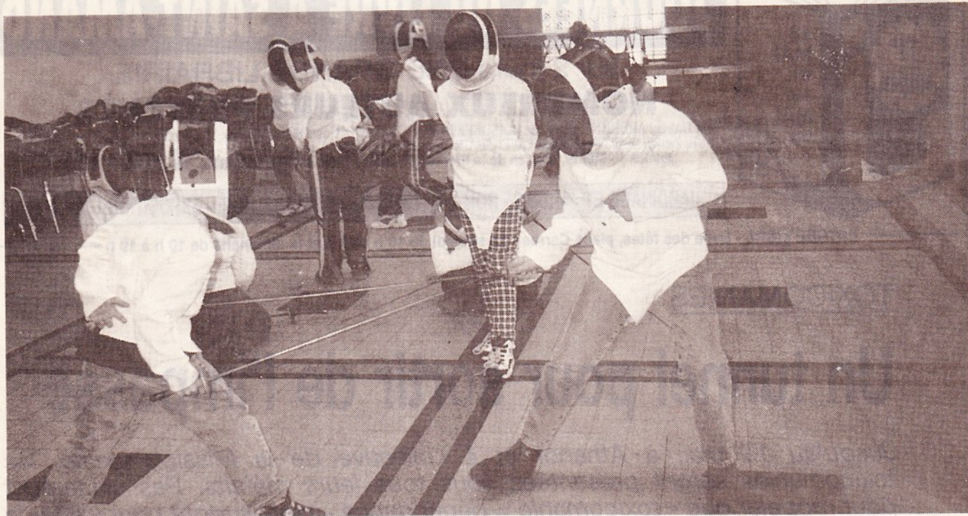
Un assaut qui obéit à des règles bien précises.

La salle des fêtes de Désertines résonne encore du bruit des lames des fleurets qui s'entrechoquaient ainsi que des commandements des jeunes arbitres : « Saluez-vous, êtes-vous prêts, en garde... ».