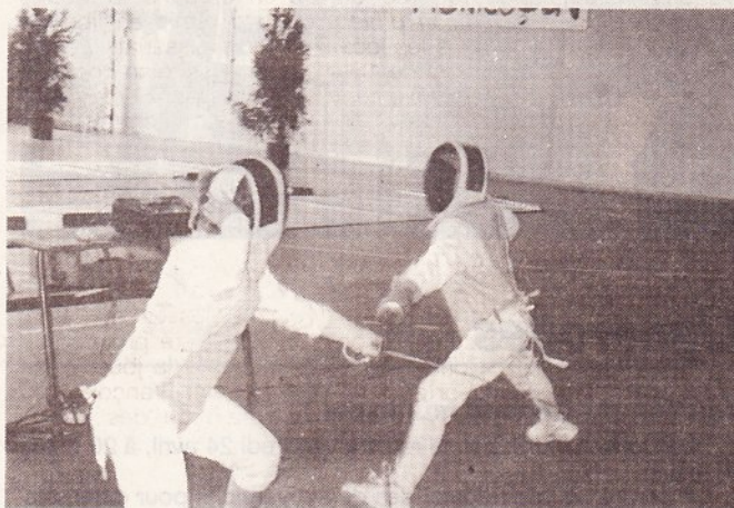
L'art de se fendre d'un coup qui fait mouche.

Même si, pour l'heure, l'escrime n'a plus l'élan des duels épiques d'autrefois entre le cercle d'escrime et la salle Lafoucrière, les responsables entendent bien aller à la conquête de nouveaux venus qui seraient attirés par l'épée, le fleuret, le sabre. Initiation, éventuellement compétition, enfants et adultes seront accueillis bras ouverts.