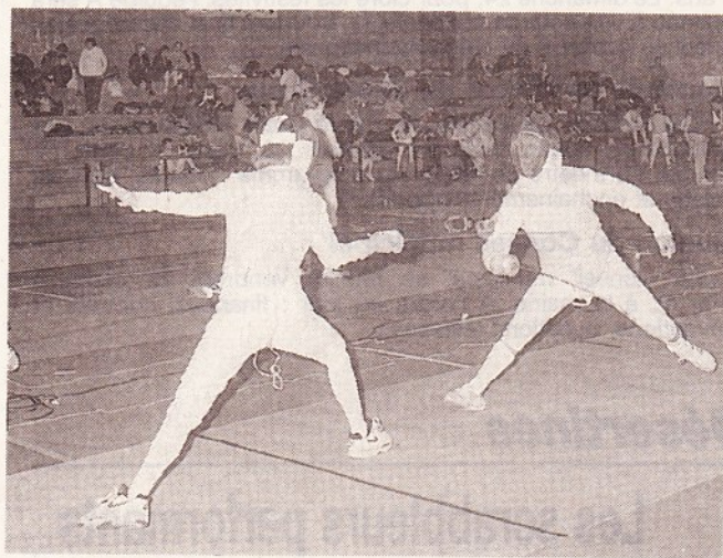
Des joutes qui donnèrent lieu à de belles attitudes de la part des jeunes Auvergnats.