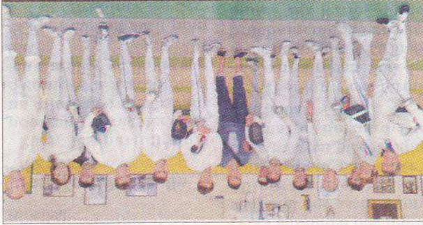
GROUPE. Les épéistes lors de la journée de reprise.

Les inscriptions de 04.70.09.06.75. Les inscriptions de rentrée auront lieu les mercredi 4 et vendredi 6 septembre.