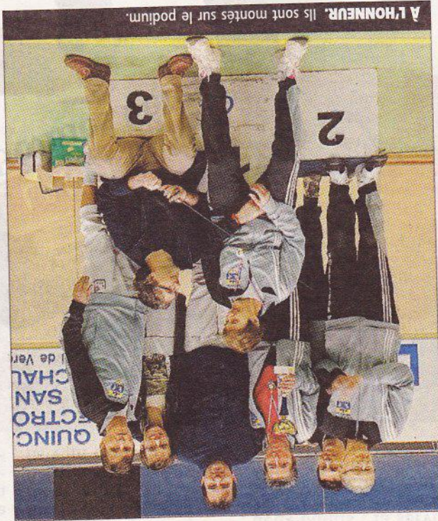
A L'HONNEUR. Ils sont montés sur le podium.