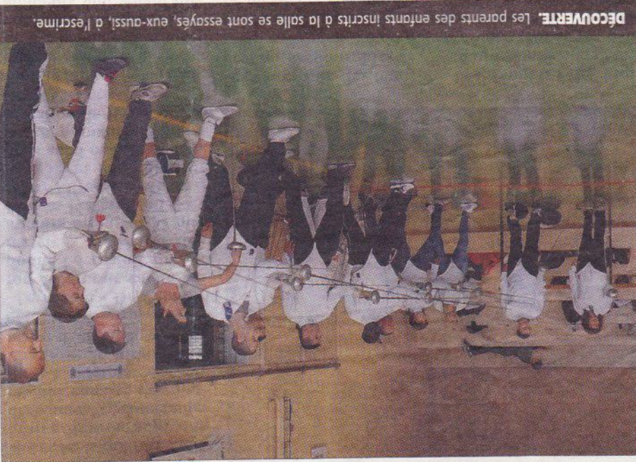
DÉCOUVERTE. Les parents des enfants inscrits à la salle se sont essayés, eux-aussi, à l'escrime.

ESCRIME ■ Marie-Jo Lepeltier s'impose en individuel à Montargis