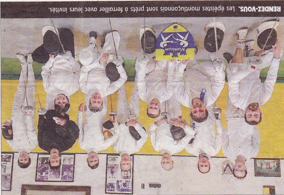
RENDEZ-VOUS. Les épéistes montluçonnais sont prêts à ferrailer avec leurs invités.

Place aux épéistes, demain, aux Guineberts et au tournoi de la ville organisé par la Salle Lafoucrière. Un rendez-vous interrégional.